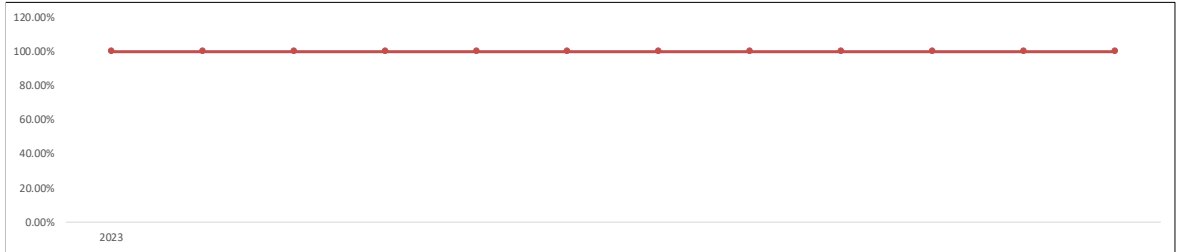
Gráfica de Resultados